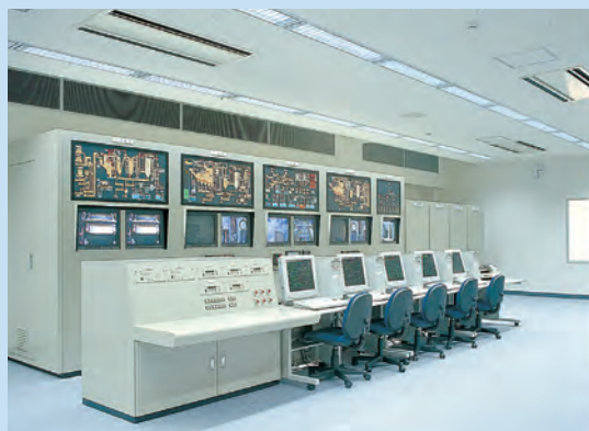
中央制御室 施設内のすべての機械の運転操作、公害対策機器の監視、制御が行われています。